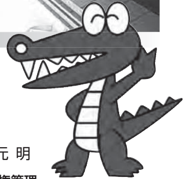
豊中市キャラクター 「マチカネくん」