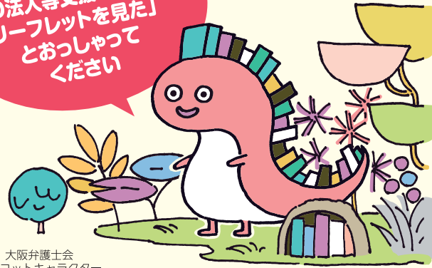
大阪弁護士会 マスコットキャラクター リーガリユー

「中小企業・NPO法人等支援センターのリーフレットを見た」とおっしゃってください