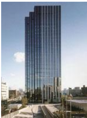
大阪中之島合同庁舎