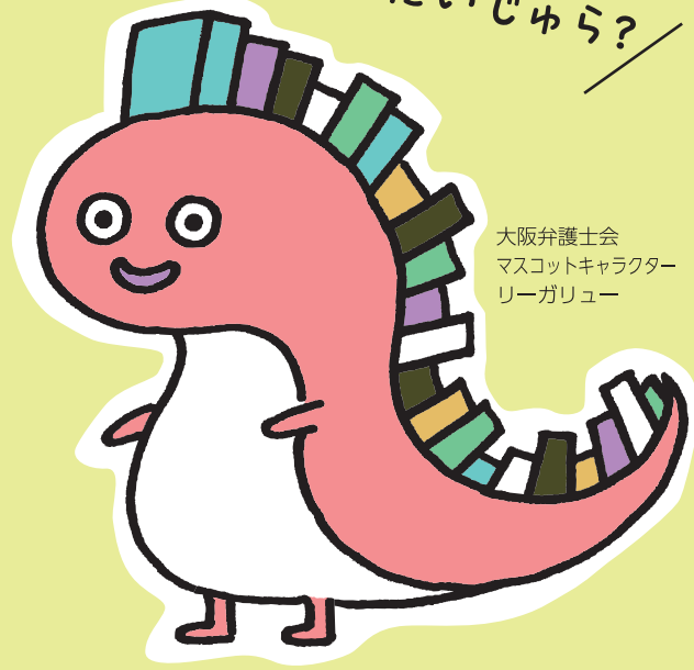
大阪弁護士会 マスコットキャラクター リーガリユ