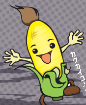
各界懇 Facebook @oosakakakuikaikon