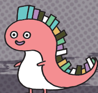
大阪弁護士会マスコットキャラクター リ-ガリユ-