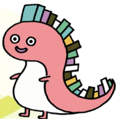
大阪弁護士会マスコットキャラクター リ・ガリュ